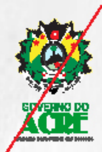
Alteração de tipografia