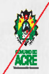
Distorção na marca