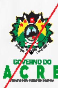
Alteração de espaçamento