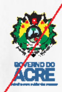
Alteração de cor