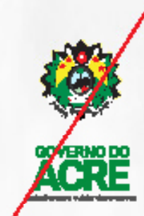
Alteração de elementos da marca